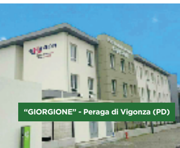
"GIORGIONE" - Peraga di Vigonza (PD)