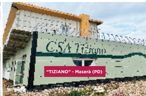
"TIZIANO" - Maserà (PD)