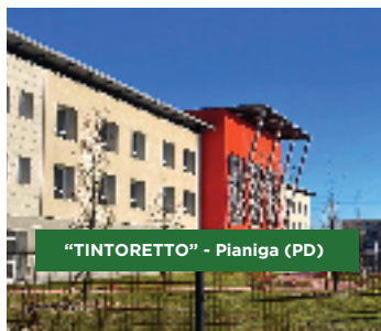
"TINTORETTO" - Pianiga (PD)