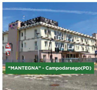
"MANTEGNA" - Campodarsego (PD)