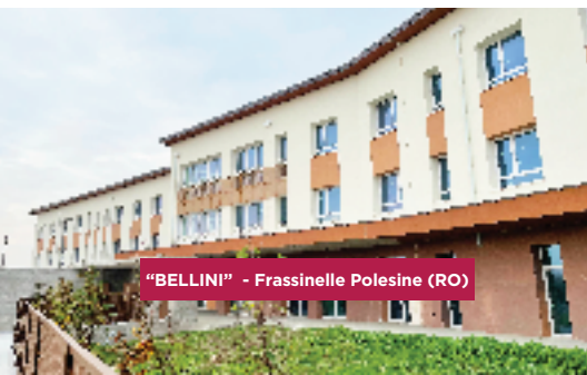
"BELLINI" - Frassinelle Polesine (RO)