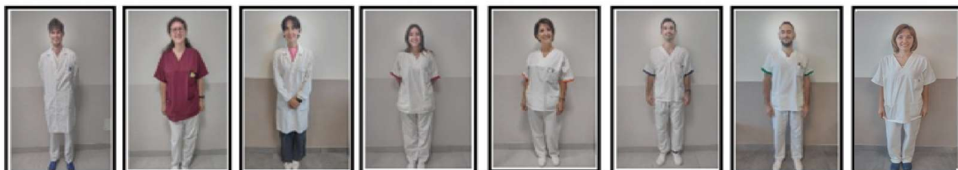
CAMICE BIANCO: MEDICO DIVISA BORDEAUX/BIANCA: COORDINATORI INF. COORDINATORE O.S.S. CAMICE BIANCO: PSICOLOGO MANICA ROSSA: INFERMIERI MANICA ARANCIONE: EDUCATORI MANICA BLU: FISIOTERAPISTI MANICA VERDE: LOGOPEDISTI MANICA BIANCA: OSS