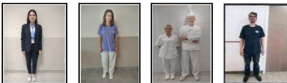
TAILLEUR: RECEPTION DIVISA BLU/BIANCA: SERVIZI GENERALI DIVISA BIANCA: PERSONALE DI CUCINA DIVISA LAVORO: MANUTENTORE