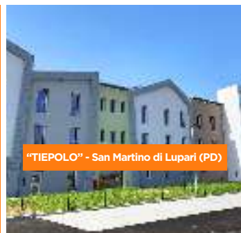
"TIEPOLO" - San Martino di Lupari (PD)