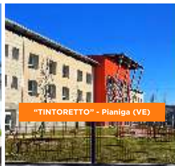
"TINTORETTO" - Pianiga (VE)