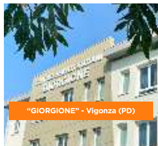
"GIORGIONE" - Vigonza (PD)