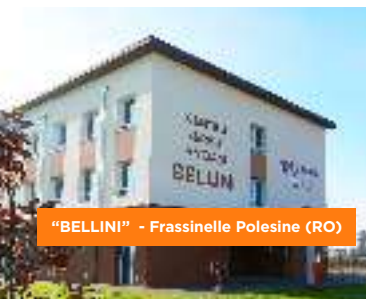
"BELLINI" - Frassinelle Polesine (RO)