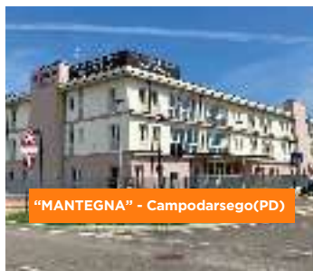
"MANTEGNA" - Campodarsego (PD)