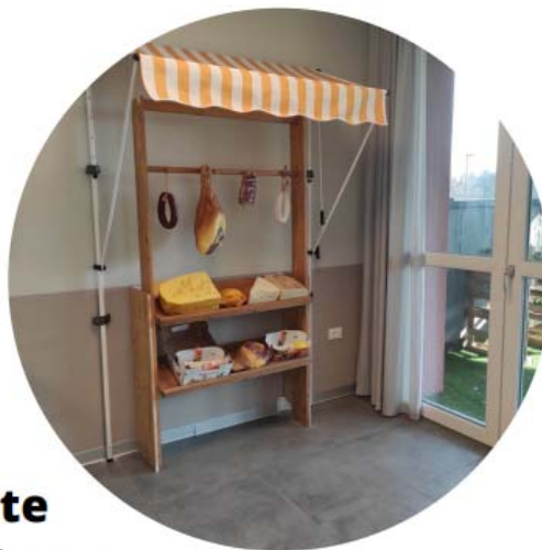
RSA Limbiate Nucleo Alzheimer