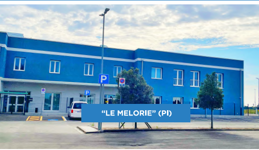
"LE MELORIE" (PI)