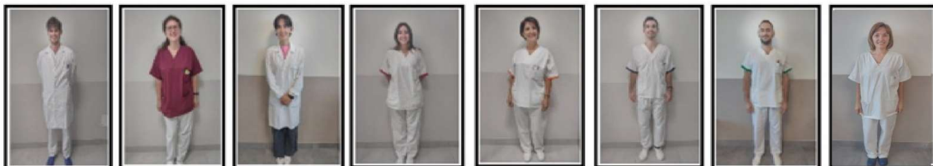
CAMICE BIANCO: MEDICO DIVISA BORDEAUX/BIANCA: COORDINATORI INF. COORDINATORE OSS. CAMICE BIANCO: PSICOLOGO MANICA ROSSA: INFERMIERI MANICA ARANCIONE: EDUCATORI MANICA BLU: FISIOTERAPISTI MANICA VERDE: LOGOPEDISTI MANICA BIANCA: OSS