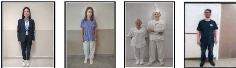
TAILLEUR: RECEPTION DIVISA BLU/BIANCA: SERVIZI GENERALI DIVISA BIANCA: PERSONALE DI CUCINA DIVISA LAVORO: MANUTENTORE