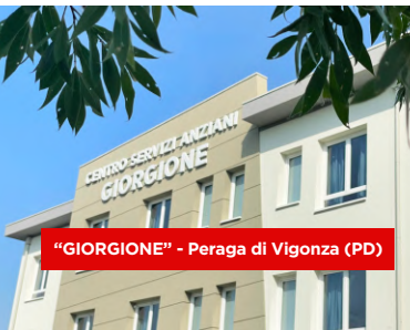
"GIORGIONE" - Peraga di Vigonza (PD)