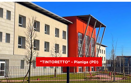
"TINTORETTO" - Pianiga (PD)