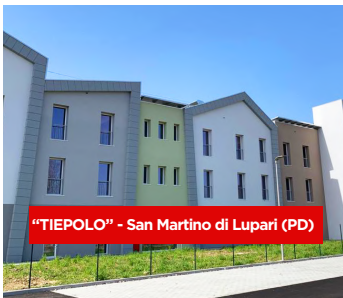
"TIEPOLO" - San Martino di Lupatari (PD)