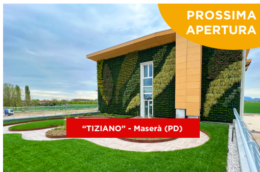
"TIZIANO" - Maserà (PD)