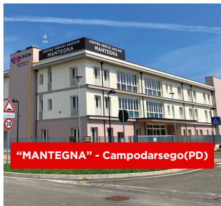
"MANTEGNA" - Campodarsego (PD)