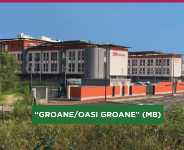
"GROANE/OASI GROANE" (MB)