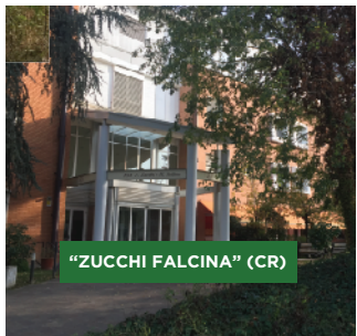
"ZUCCHI FALCINA" (CR)