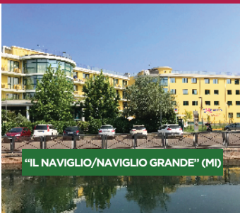
"IL NAVIGLIO/NAVIGLIO GRANDE" (MI)