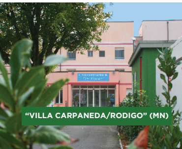
"VILLA CARPANEDA/RODIGO" (MN)