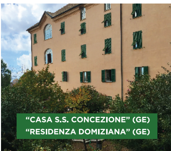
"CASA S.S. CONCEZIONE" (GE) "RESIDENZA DOMIZIANA" (GE)