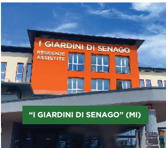
"I GIARDINI DI SENAGO" (MI)