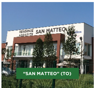
"SAN MATTEO" (TO)