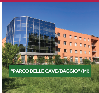
"PARCO DELLE CAVE/BAGGIO" (MI)