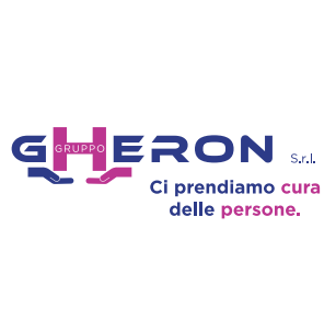
"VILLA CARPANEDA/RODIGO" (MN)