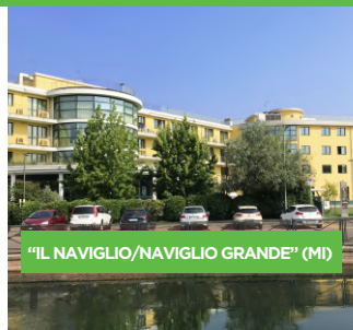
"IL NAVIGLIO/NAVIGLIO GRANDE" (MI)