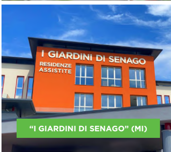
"I GIARDINI DI SENAGO" (MI)