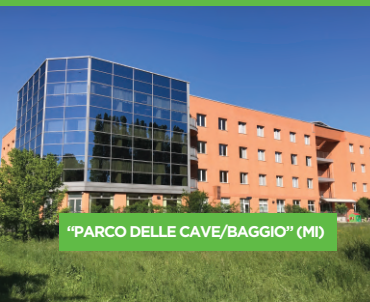
"PARCO DELLE CAVE/BAGGIO" (MI)