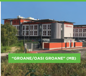
"GROANE/OASI GROANE" (MB)