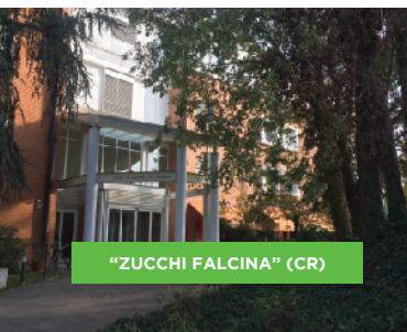
"ZUCCHI FALCINA" (CR)