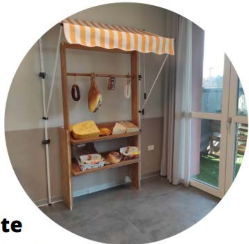
RSA Limbiate Nucleo Alzheimer