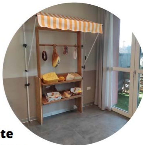
RSA Limbiate Nucleo Alzheimer