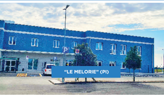
"LE MELORIE" (PI)