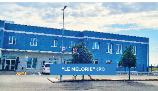
"LE MELORIE" (PI)