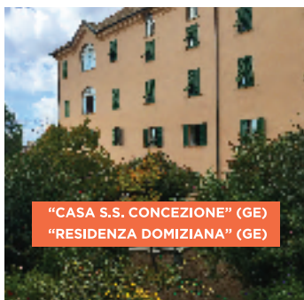
"CASA S.S. CONCEZIONE" (GE) "RESIDENZA DOMIZIANA" (GE)