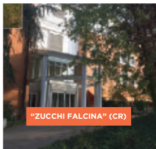
"ZUCCHI FALCINA" (CR)