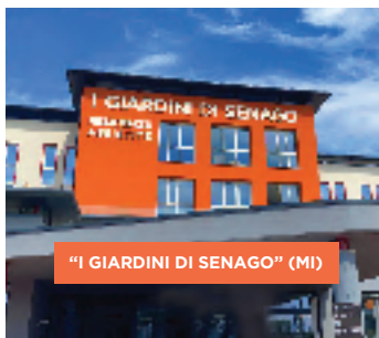
"I GIARDINI DI SENAGO" (MI)