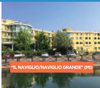
"IL NAVIGLIO/NAVIGLIO GRANDE" (MI)