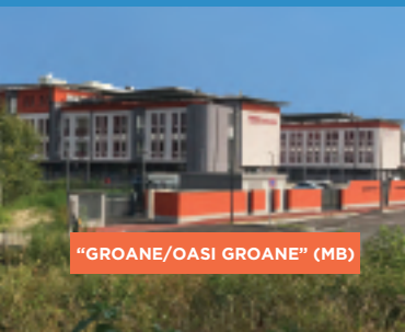
"GROANE/OASI GROANE" (MB)