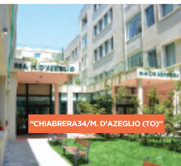
"CHIABRERA34/M. D'AZEGLIO" (TO)