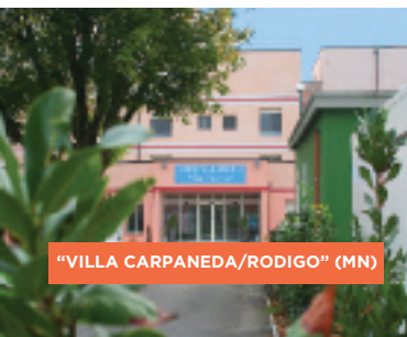
"VILLA CARPANEDA/RODIGO" (MN)