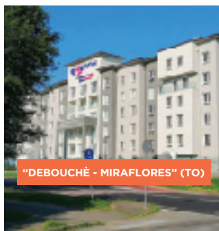
"DEBOUCHÈ - MIRAFLORES" (TO)