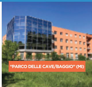
"PARCO DELLE CAVE/BAGGIO" (MI)